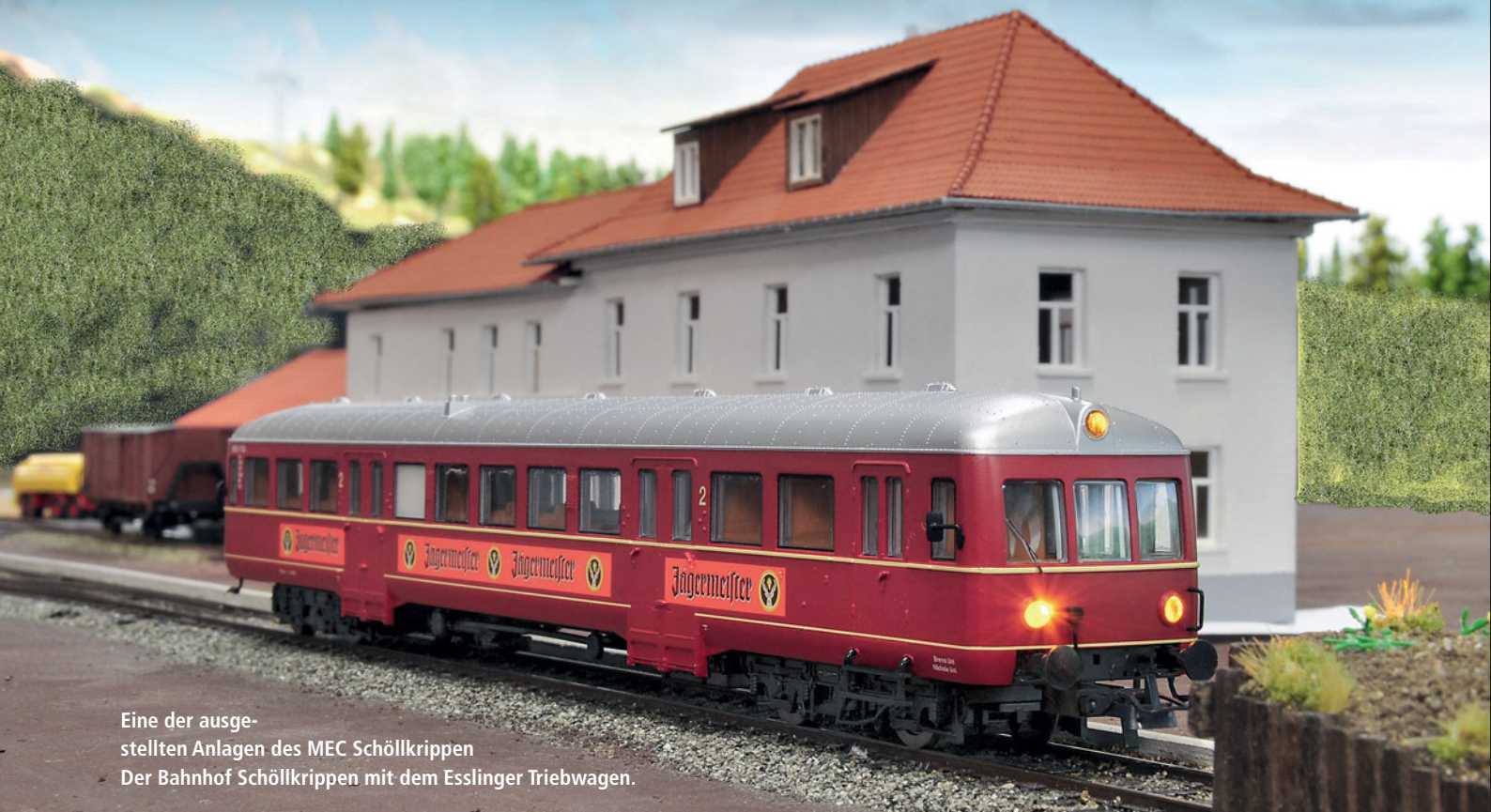
Eine der aus- gestellten Anlagen des MEC Schöllkrippen Der Bahnhof Schöllkrippen mit dem Esslinger Triebwagen.

60. Bundesverbandstag des BDEF in Frankfurt/M